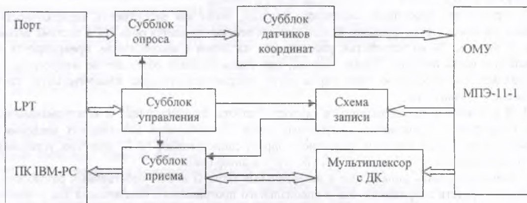
Рисунок 1 – Блок-схема модернизированного АРМ-1 для измерения угловых характеристик взаимодействий в толстослойных фотоэмульсиях

Применение такого метода съёма информации дает экономию кабельных соединений, сокращает число используемых разъёмов, исключает необходимость логического переключателя для выбора номера программы в универсальном ФЭМ, и, соответственно, повышает надёжность устройства в целом. При такой организации связи ЭВМ с микроскопом типа МПЭ-11 необходимо всего 23 информационные линии: 12 линий опроса, 10 приёмных линий и 1 линия для кнопки "Запись". На рисунке 1 приведена блок-схема АРМ-1.