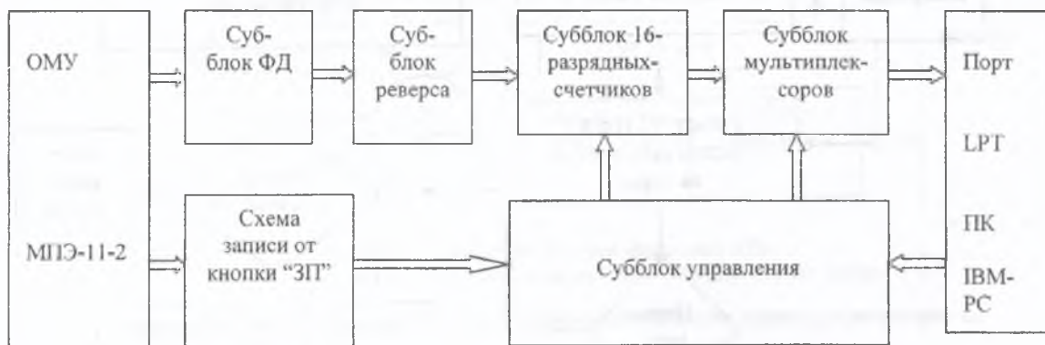
Рисунок 2 – Блок-схема модернизированного АРМ-2 для измерения угловых характеристик ядерных взаимодействий в толстослойных фотоэмульсиях

Учитывая вышеизложенное, а также, что для определения физических характеристик необходимо знать только приращения координат (это следует из расчётных формул), были разработаны, изготовлены и отлажены простые в изготовлении, надёжные в эксплуатации и лёгкие в ремонте фотоэлектрические круговые ДК, содержащие один кодовый диск с 32 щелями и всего две пары "источник света-фотоприёмник", в которых источником света служат сверхминиатюрные лампочки накаливания, а фотоприёмником – обычные кремниевые фотодиоды. Такой датчик, снабжённый усилителем и схемой реверса, позволяет преобразовать значение угла поворота вала соответствующего привода в две серии последовательных импульсов, сдвинутых на 90^\circ и на каждый оборот вырабатывает 128 импульсов. В практическом исполнении такой измерительный тракт позволил повысить надёжность определения координат в универсальных фотоэмульсионных микроскопах, традиционно использующих позиционные датчики координат, работающих в коде Баркера. При таком подходе информация о текущих значениях координат точек следа частицы программно формируется, отслеживается и хранится в буферной зоне памяти. На основе таких ДК и соответствующего им электронного блока измерителя, ориентированного на подключение к ПК был создан модернизированный АРМ-2 на базе ПК и ОМУ МПЭ-11 (рисунок 2).